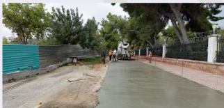
Διαμόρφωση περιμετρικής οδού της Σχολής Εθνικής Άμυνας.

Δημιουργήθηκε νέα εξωτερική περιμετρική οδός στην βόρεια και δυτική πλευρά της Σχολής Εθνικής Άμυνας προς την πλατεία Πρωτομαγιάς για την ασφαλή κίνηση και εξυπηρέτηση κατοίκων της περιοχής και των οχημάτων που συμμετέχουν σε εκδηλώσεις εορτασμών της Σχολής.