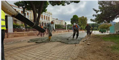
Εργασίες τοιμεντότρωξης δρόμου προς την πλατεία Πρωτομαγιάς.

Δημιουργήθηκε νέα εξωτερική περιμετρική οδός στην βόρεια και δυτική πλευρά της Σχολής Εθνικής Άμυνας προς την πλατεία Πρωτομαγιάς για την ασφαλή κίνηση και εξυπηρέτηση κατοίκων της περιοχής και των οχημάτων που συμμετέχουν σε εκδηλώσεις εορτασμών της Σχολής.