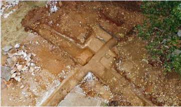
Αρχαιολογικές τομές στον «Στ. Δικαστήρια».

Ολοκληρώθηκαν οι αρχαιολογικές εργασίες στο Φρέαρ ΤΒΜ Κατεχάκη και ξεκίνησαν στα εργοτάξια των σταθμών «Κολωνάκι» και «Δικαστήρια» και συνεχίζονται στο «Φρέαρ Βείκου» και στον «Στ. Ακαδημία» με την εποπτεία των αντίστοιχων κατά τόπους αρμόδιων Εφορειών Αρχαιοτήτων με σκοπό την διερεύνηση, προστασία και ανάδειξη των αρχαιολογικών ευρημάτων.