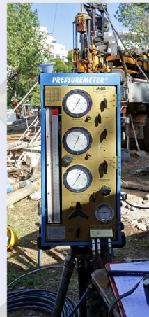
Συσκευή ελέγχου και ανάγνωσης μετρήσεων δοκιμής πρεσομέτρου.

Κατά την διάρκεια των γεωτρήσεων εκτελούνται πλήθος δοκιμών στο εργαστήριο και στο πεδίο οι οποίες χρησιμοποιούνται για τον προσδιορισμό των γεωτεχνικών παραμέτρων σχεδιασμού του Έργου.