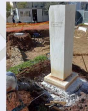
Βάθρο Γρηγόριου Ξενοπούλου στην Ακαδημία.