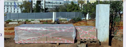
Συσκευασμένο μαρμάρινο ομοίωμα «Κυβέλη» προς μετακίνηση.

Ήδη πολλοί από τους ανδριάντες που βρίσκονται εντός εργοταξιακών χώρων έχουν συσκευαστεί ώστε να αποθηκευτούν προσωρινά σε φυλασσομένους χώρους για να μεταφερθούν μελλοντικά σε νέες θέσεις που θα υποδειχθούν από τους εκάστοτε Δήμους. Η πρώτη απομάκρυνση του μαρμάρινου ολόσωμου ομοιώματος της Κυβέλης από τον «Στ. Ακαδημία» πραγματοποιήθηκε με επιτυχία με τη βοήθεια γερανοφόρου οχήματος και υπό την επίβλεψη του Τμήματος Πολιτιστικής Κληρονομιάς του Δήμου Αθηναίων και στελεχών της ΑΤΤΙΚΟ ΜΕΤΡΟ Α.Ε..