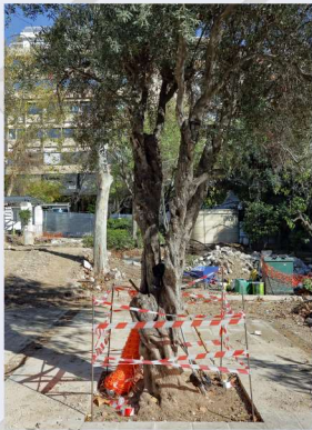
Ελιά στην πλατεία Κολωνακίου, η οποία πρόκειται να μεταφυτευθεί.

Το μετρό, το πιο «πράσινο» μέσο μαζικής μεταφοράς έχει σκοπό να μειώσει την ατμοσφαιρική ρύπανση και τον όγκο των αυτοκινήτων ώστε να αντιμετωπίσει την μεγάλη πρόκληση της κλιματικής αλλαγής. Η ΑΤΤΙΚΟ ΜΕΤΡΟ Α.Ε. με απόλυτο σεβασμό στο περιβάλλον, σε συνεργασία με τους δήμους που θα φιλοξενήσουν τα εργοτάξια της Γραμμής 4Α, έχει αναλάβει να μεταφυτεύσει το σύνολο των δέντρων που μπορούν να μεταφυτευθούν μετά από οργανωμένες μελέτες προστασίας αστικού πρασίνου σε χώρους που θα υποδειχθούν από τις αρμόδιες υπηρεσίες των Δήμων. Η πρώτη φάση των μεταφυτεύσεων έχει ήδη ξεκινήσει στα όρια του Δήμου Αθηναίων και αρκετά δέντρα έχουν μεταφερθεί στο φυτώριο του Δήμου, στην οδό Κανελλοπούλου δίπλα στο Νοσοκομείο της Αεροπορίας (ΓΝΑ).