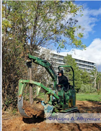
Φυτώριο Δ. Αθηναίων