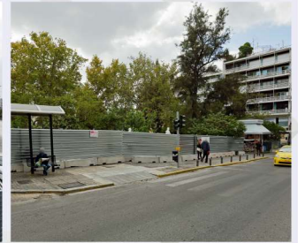
Εργοταξιακή περίφραξη στο «Στ. Κολωνάκι».

Εργοταξιακές περιφράξεις τοποθετήθηκαν στα νέα εργοτάξια στην Λεωφόρο Αλεξάνδρας, στην πλατεία Κολωνάκιου και έγινε επέκταση της περίφραξης στην Λεωφόρο Βείκου για την έναρξη πρόδρομων εργασιών των σταθμών «Αλεξάνδρα», «Κολωνάκι» και «Φρέαρ ΤΒΜ Βείκου» αντίστοιχα.