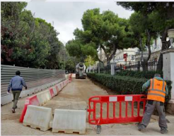
Κατασκευή τμήματος περιμετρικής οδού βόρεια της Σχολής Εθνικής Άμυνας.