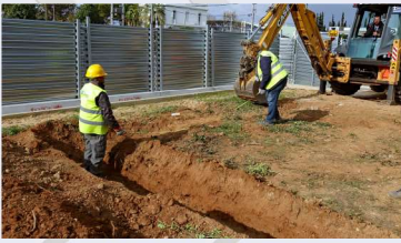
Αρχαιολογικές τομές στο «Φρέαρ ΤΒΜ Βείκου».