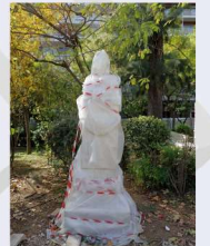
Προτομή Ειμανουήλ Ξάνθου στο Κολωνάκι.