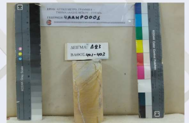
Δοκίμιο πριν την εκτέλεση δοκιμής τριαξονικής θλίψης.