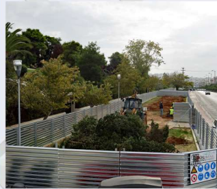
Εργοταξιακή περίφραξη στο «Φρέαρ Βείκου».